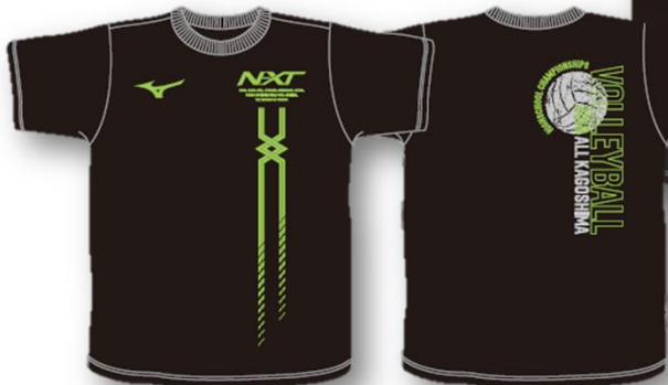
■Tシャツ-C (イロ-グリーン*シルバー)