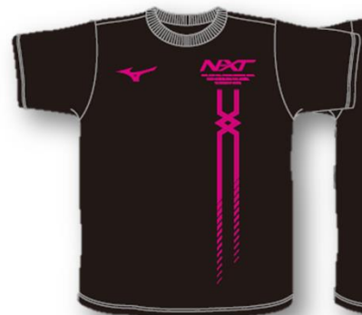
■Tシャツ-A (ピンク*シルバー)