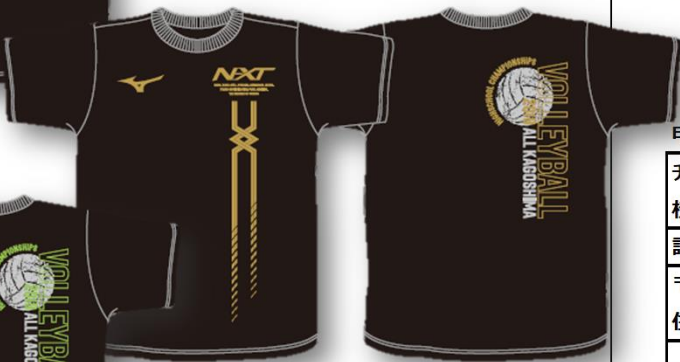
■Tシャツ-D (ゴールド*シルバー)