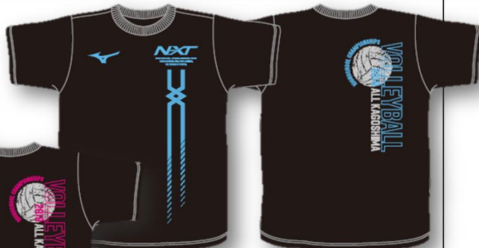
■Tシャツ-B (サックス*シルバー)