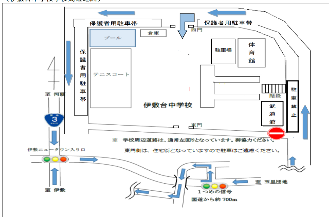
〔伊敷台中学校学校周辺地図〕